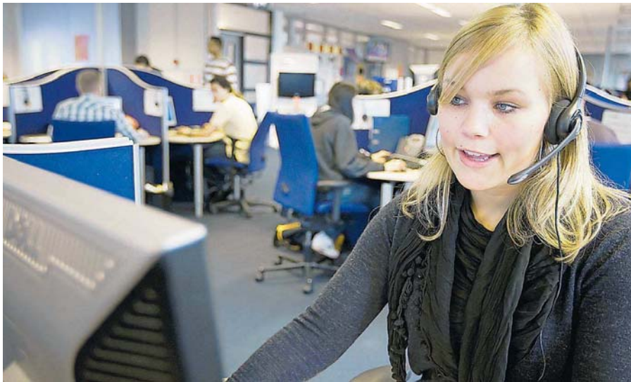
Telefonmarketing mit Einverständnis der Kunden ist zulässig. Offenkundig gibt es aber viele schwarze Schafe am Markt.

Saarbrücken. Beamte des Zollamts Saarbrücken haben jetzt mehr als 2600 Elektrokabel aus China mit einer gefälschten Kennzeichnung des Verbandes der Elektrotechnik (VDE) sichergestellt. Die Elektrokabel seien vernichtet worden. Wie die Beamten mitteilen, sei das VDE-Kennzeichen markenrechtlich geschützt und dürfe vom Warenhersteller nur auf den Produkten angebracht werden, die vom VDE Prüf- und Zertifizierungsinstitut getestet und freigegeben worden sind. Diese Kennzeichnung soll Produktsicherheit garantieren. „Die Sicherheit der Produkte ist sehr wichtig, aber solche Verstöße stellen wir im Rahmen der zollrechtlichen Abfertigung immer wieder fest“, erklärte Diana Weis, Sprecherin des Hauptzollamts Saarbrücken. Die Elektrokabel hatten einen Wert von 4000 Dollar, also von knapp 3000 Euro. Seit Anfang 2009 arbeiten die europäischen Zollbehörden und das VDE-Institut zusammen. Um Plagiate aufzuspüren, kontrollieren die Zollbehörden die Vorlage eines gültigen Zertifikats für jedes VDE-Prüfzeichen an einem Produkt. red